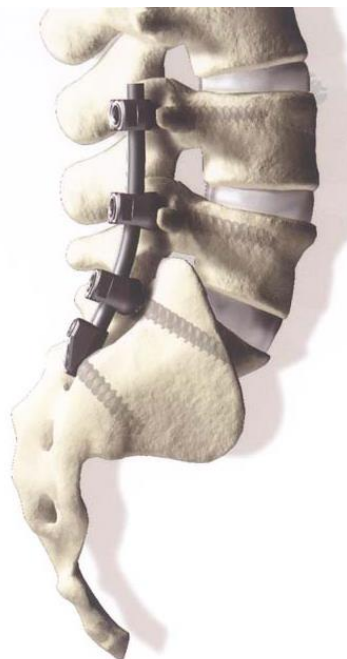
Sådan ser rygsøjlen ud, når den er stabiliseret med skruer og stave.

For at undgå blodansamling skal du så vidt muligt ligge fladt på ryggen de første 4 timer efter operationen. Herefter må du vende dig efter behag. Hovedgærdet må hæves til maksimalt 30 grader.