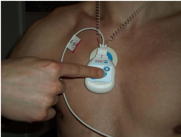
Tryk på den store knap, hvis du vil aktivere apparatet.

4. Tryk nu, med et enkelt tryk, på den store knap i midten. Du hører nu en hylelyd i 20 sekunder. Derefter går lyden over til at blive en mere regelmæssig lyd.