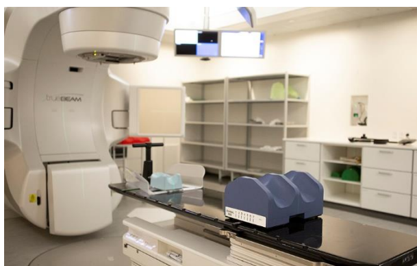
Du vil blive lejret på forskellig måde, afhængigt af hvor på kroppen, du skal skannes. Lejringsmateriale er de støttetmaterialer, du ligger på. Her ses lejringsmaterialer til behandling ved fx lungekræft.