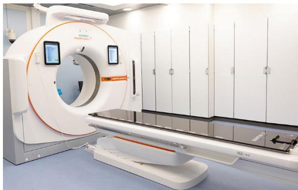
Sådan ser skanneren ud. Ved hjælp af skanningen kan vi planlægge din behandling.

I forbindelse med skanningen laver vi et lejringsmateriale specielt til dig. Lejringsmaterialet skal sikre, at du ligger på samme måde ved behandlingerne, og kan slappe af, mens behandlingen står på. Lejringsmaterialet bruges ved alle dine behandlinger.