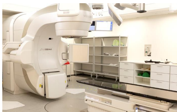
Sådan ser acceleratoren ud, der giver strålebehandlingen.

Du vil derefter få den første behandling ved en accelerator, som er det apparat, der giver strålebehandling.