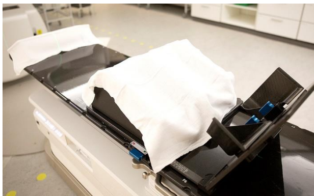
Lejringsmaterialerne her bruges, hvis du får behandling i bækkenområdet.