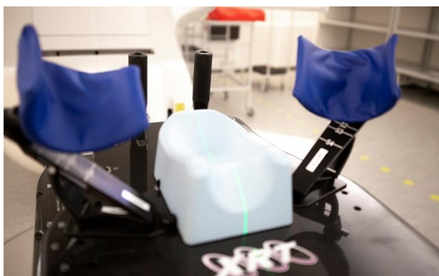
Her ses lejringsmaterialet til behandling på overkroppen fx brystkræft, hvor armene hviler i de mørkeblå støtter og nakken hviler i den lyseblå pude.