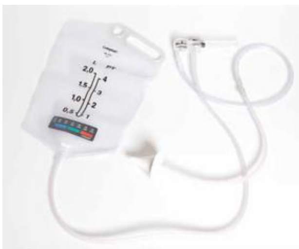
Eksempel på skyll sæt, der anvendes ved skylning af tarmen.