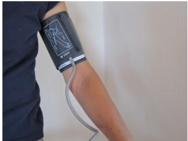
Sådan skal blodtryksmanchetten sidde på armen.