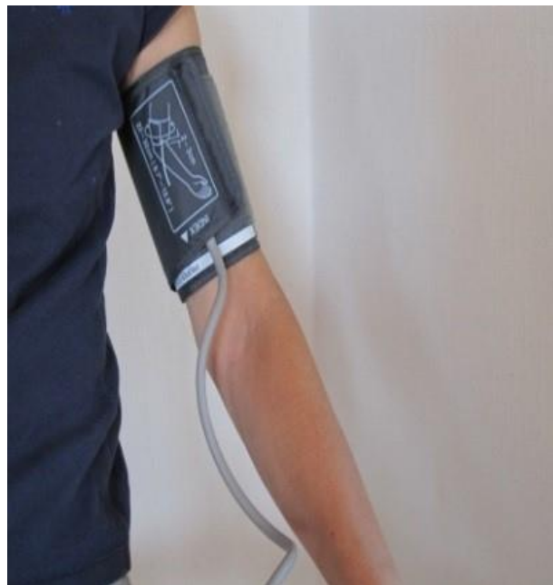
Sådan skal blodtryksmanchetten sidde på armen.