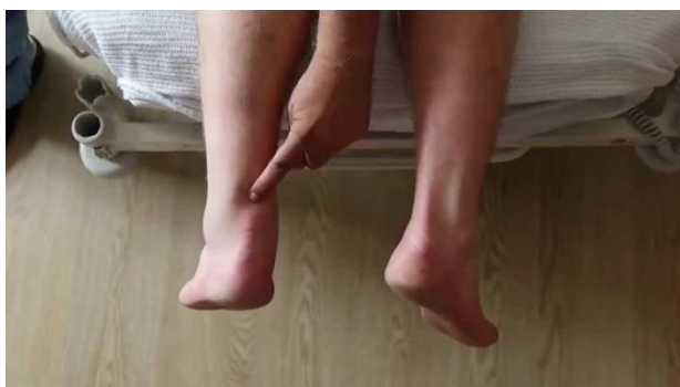
Overrevet akillessene

Din akillessene er revet over, og derfor er din fod i en Walker-støvle med 3 kiler under hælen. Senen aflastes, når foden holdes helt strakt i spidsfod.