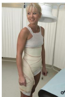
Elastikbindet fjernes efter et par minutter, og så er korsettet færdigt.