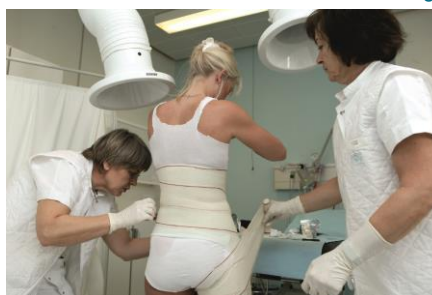
Sygeplejerskerne fastgør polsterkanterne med tape.