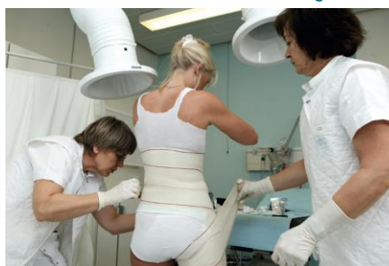
Sygeplejerskerne ruller våde elastikbind på for at fremskynde hærdningen af korsettet.