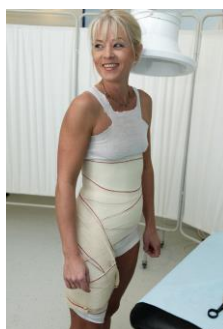
Elastikbindet fjernes efter et par minutter, og så er korsettet færdigt.