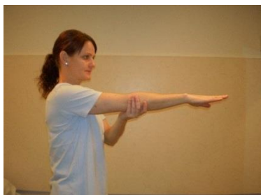
Løft armen aktivt og ubelastet til vandret (90 grader).

Lægen har ordineret, at du skal have bandagen på hele tiden de første 3 uger, undtagen når du klæder dig af og på, vasker dig eller laver øvelser. Tag derfor armen ud af bandagen, mens du laver øvelserne i denne pjece, men sørg for, at du ikke bevæger armen ved hjælp af skulderens muskler.