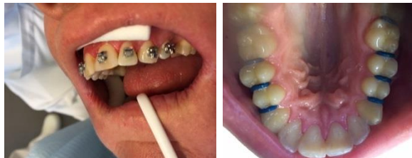
Du får limet låse på tænderne og sat små elastikker mellem kindtænderne.