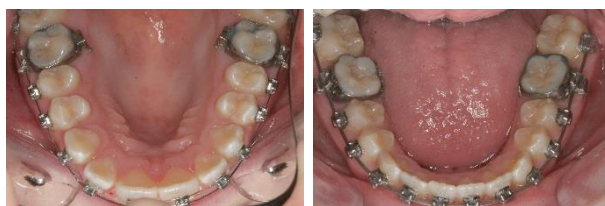
Du får bånd og buer på tænderne i overmund og undermund.

Vi limer bånd på dine kindtænder og tilpasser buer. Behandlingen varer cirka 2 timer.