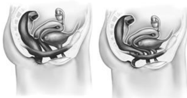
Bækkenbunden i hvile

Når du kniber, løftes bækkenbunden lidt op, og trækker urinrør, skede og endetarm fremad mod kønsbenet. Denne bevægelse gør, at der opstår et knæk på urinrør, skede og endetarm, så de lukkes.