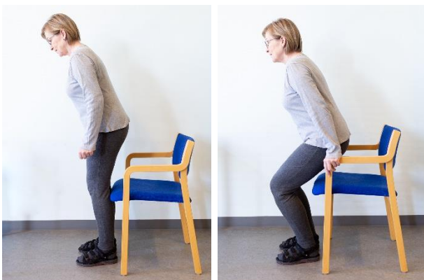
Stå let foroverbøjet.