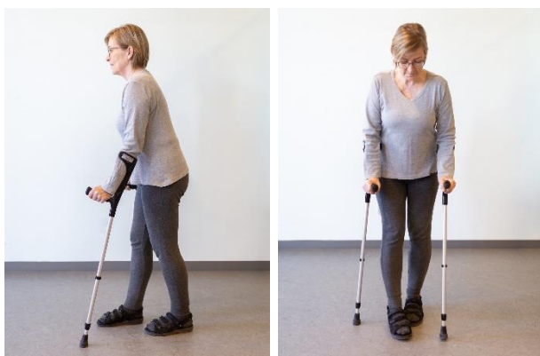
Albuestokke indstilles lidt for lavt, så du går en smule foroverbøjet.