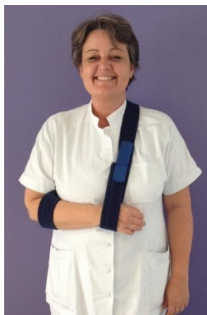
Slyngen set forfra.