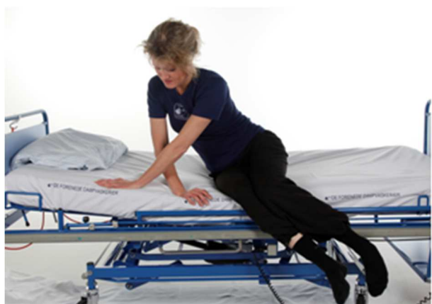
Sådan kommer du ud af sengen – læs mere på næste side.