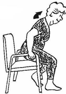
Sådan rejser du dig fra en stol