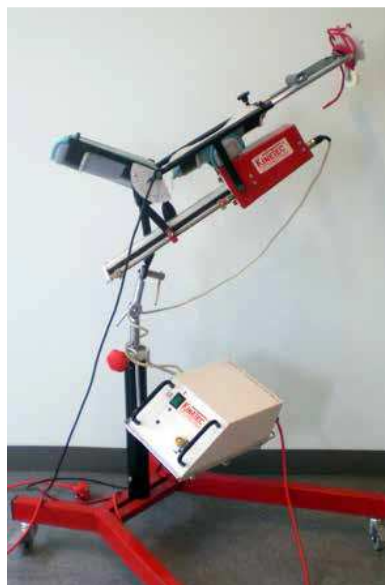
Du skal træne armen i Kinetec-maskinen.

Mens du er indlagt, skal du typisk træne armen i en såkaldt Kinetec-maskine (CPM), der passivt bevæger din arm igennem. Det vil sige, at du ikke bruger albueens muskler til at bøje og strække armen med. En fysioterapeut hjælper dig i gang med at bruge maskinen og viser dig de øvelser, som du skal lave, når du kommer hjem.