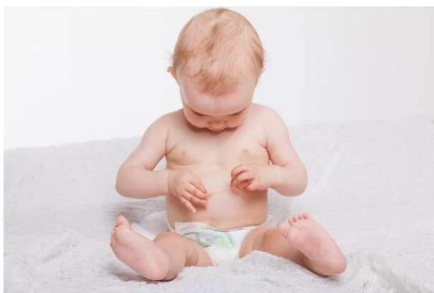
Barnets hud skal smøres med fugtighedscreme hver dag, så den holder sig blød og smidig. Hvis der kommer eksem, skal huden behandles med steroidcreme.

Undgå at massere huden ved smøring, da huden skal have ro til at hele.