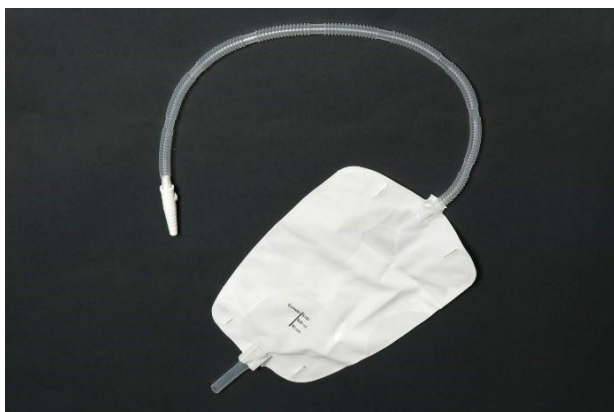
Sådan ser posen til dagtimerne ud.

Du skal som minimum tømme posen, når den er \frac{3}{4} fuld, eller hvis den generer dig.