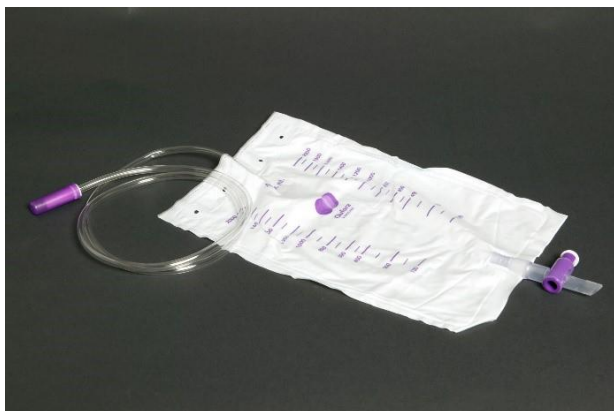
Sådan ser natposen ud.