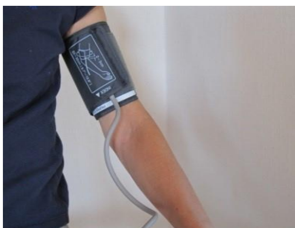
Sådan skal blodtryksmanchetten sidde på armen.