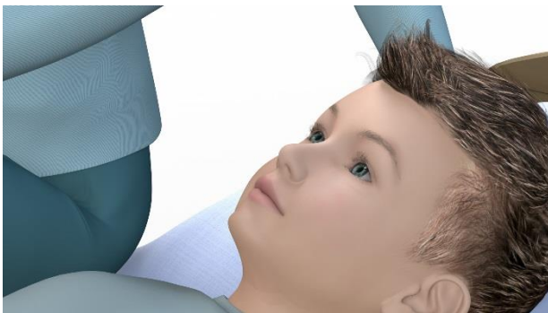
5. Når barnet åbner øjnene, løber dråberne ind i øjet.