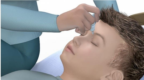
4. Anbring et par dråber i øjenkrogen.