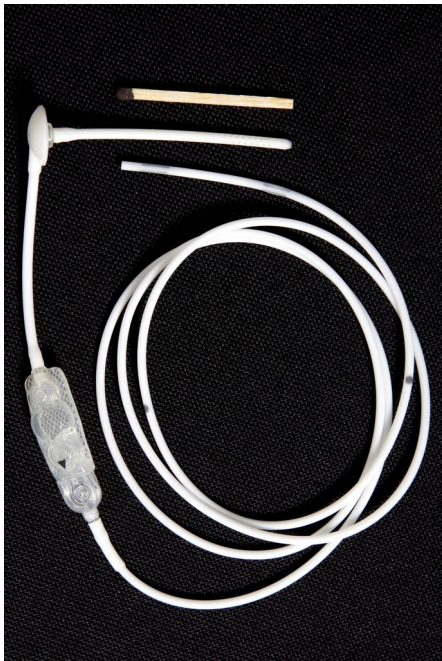
Her ses dræn og ventil, som skal indsættes under operationen

For at afhjælpe dette tryk er det nødvendigt at indsætte en ventil og et dræn i kraniet, som den overskydende væske kan blive ledt væk gennem. Ventil og dræn er permanente, og skal altså blive siddende, så sygdommen ikke fortsætter med at genere dig.