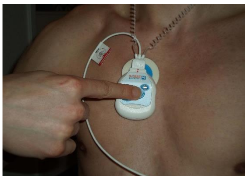
Tryk på den store knap på forsiden, hvis du selv vil aktivere apparatet.

Apparatet vil automatisk optage og gemme din hjerterytmе, hvis den afviger fra en normal hjerterytmе. Du kan også selv aktivere apparatet. Hvis du får symptomer fra hjertet, kan du trykke på den store knap på forsiden af apparatet.