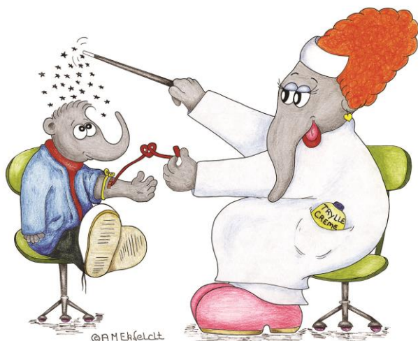
Ligesom Tobi får du et lille stik i din arm.

Du skal helst blive i sengen under hele undersøgelsen.