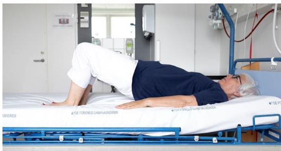
Ballemuskulatur, billede 2B - bækkenløft