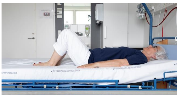
Ballemuskulatur, billede 2