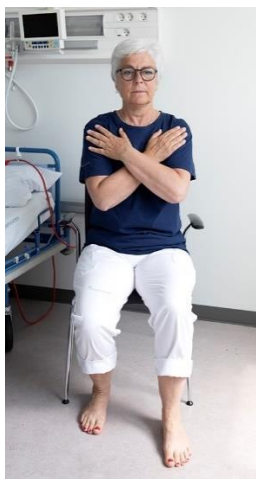
Balle- og lårmuskulatur, billede 3