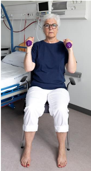
Skulder- og armmuskulatur, billede 2