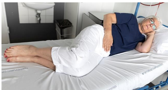
Muskelkorsettet, billede 2