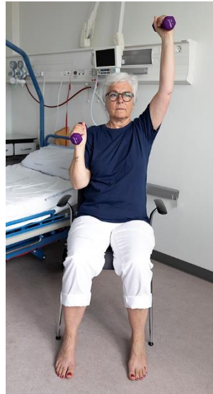
Billede 2B, vægtøvelse