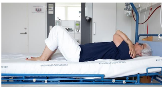
Ballemuskulatur, billede 3