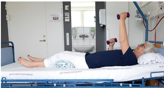
Skulder- og armmuskulatur, billede 1B, vægtøvelse