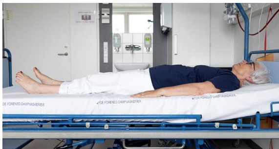
Ballemuskulatur, billede 1