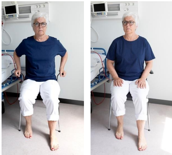
Balle- og lårmuskulatur, billede 1 og 2