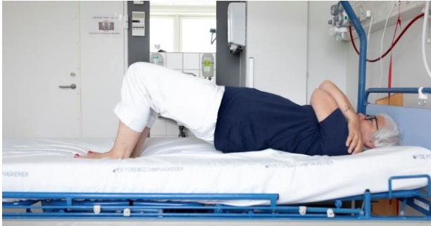
Ballemuskulatur, billede 3B - bækkenløft