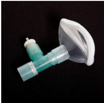
Maske i tre dele.

I denne pjece kan du læse, hvordan du giver barnet behandlinger med PEP-masken.