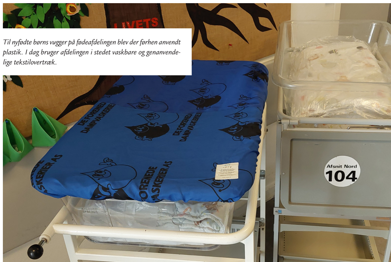
Til nyfødte børns vugger på fødeafdelingen blev der førhen anvendt plastik. I dag bruger afdelingen i stedet vaskbare og genanvendelige tekstilovertræk.

På fødeafdelingen var engangsløsninger af plastik tidligere en fast del af hverdagen. Ved hver fødsel blev der i gennemsnit anvendt otte plastikunderlag, der alle blev smidt ud efter en enkelt gangs brug. Det lyder måske ikke af meget, men med mere end 3.500 fødsler om året brugte afdelingen ca. 28.000 plastikunderlag om året. I dag er underlagene skiftet ud med vaskbare inkontinensunderlag, som er små plastikstykker, der kan vaskes og genanvendes op til 75 gange.