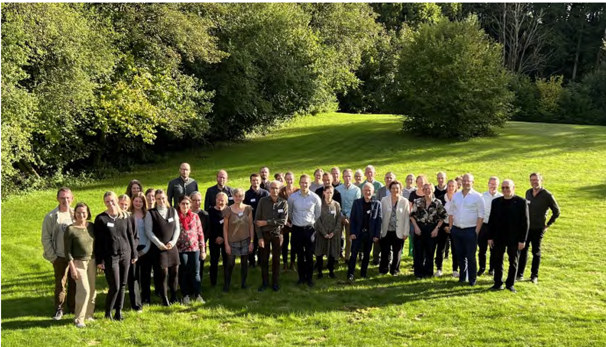
Deltagere ved KKFCs 11. årsmøde i Hobro, oktober 2023