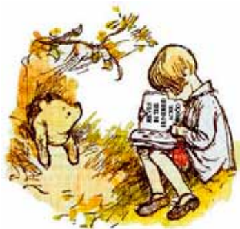
Narrativ tilgang Illustration: E. H. Shepard

Med andre ord peger min forskning på, at det er livsbeholdende at lade de børn, der er kommet i klemme, sidde lidt i hullet, mens vi bliver sammen med dem. I den situation kan vi læse trøstende og stimulerende fortællinger (som Peter Plys siger det ...), mens vægten falder. Så længe børnene kan få vejret, er der ikke nogen god grund til uforkammet at hive og slide i børnene – de risikerer at få armene rykket af!