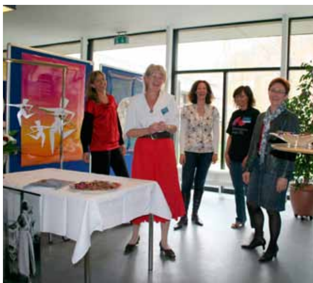
Sygeplejestanden, Forskningens Døgn

Aalborg Sygehus satte i 2008 ekstra spot på nytænkningen i det danske sundhedsvæsen til gavn for såvel borgere som erhvervsliv. Afdeling for Universitetshospitalsanliggender har haft travlt med at levendegøre en ny innovationsstrategi, de-