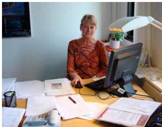
Forskningsenhed for Klinisk Sygepleje, den 1. februar 2009