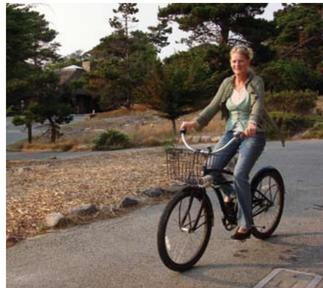
Forskningsenhed for Klinisk Sygepleje, den 1. februar 2008