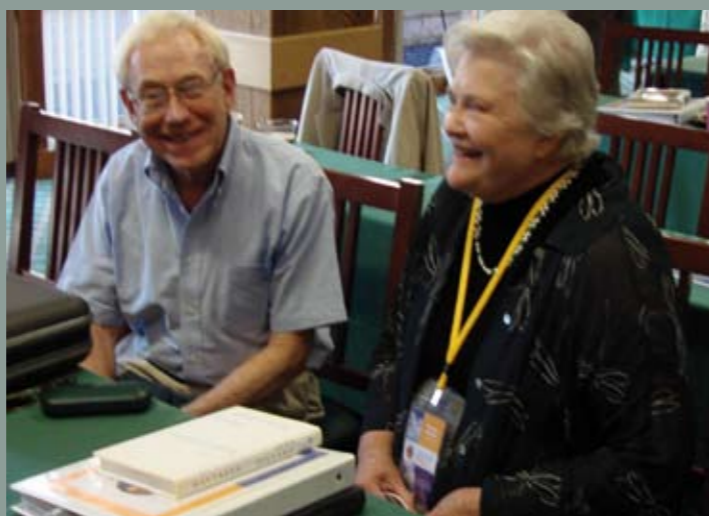
Professor Hubert Dreyfus og professor Patricia Benner .