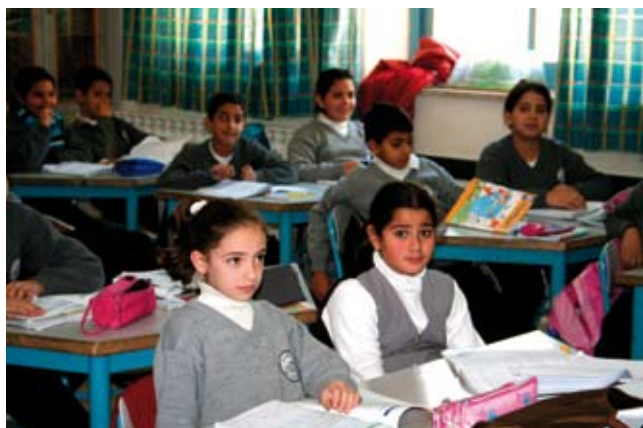
5.klasse på Dar al Karlima School.