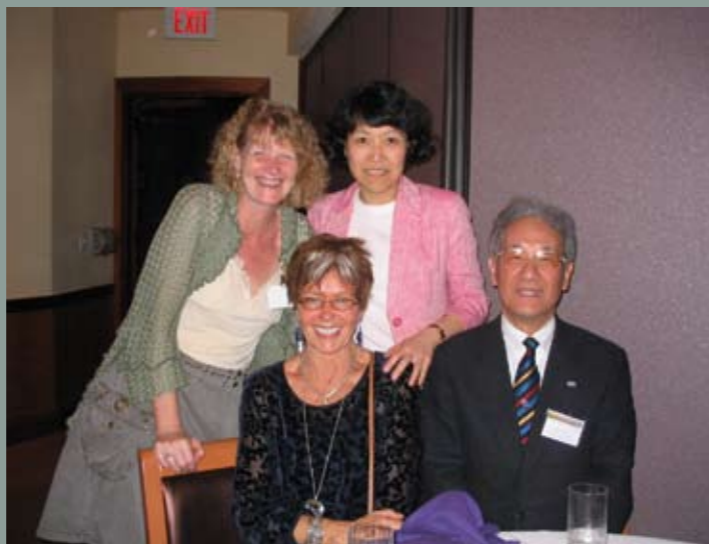
Professor Jean Watson omgivet af de internationale tænke-tank medlemmer. Foruden Danmark - Hongkong og Japan.

Årets særlige begivenhed var en invitation fra professor Patricia Benner til hendes retirement-symposium, afholdt i Asilomar, Californien. Denne begivenhed var faglig berigende, idet tidligere ph.d.-studerende bredte en vifte ud af de forskellige forskningsprojekter, som var inspireret af og forankret i Benners mangeårige arbejde med omsorgen og udvikling af klinisk ekspertise. Samtidig var det også lidt trist, for med dette symposium blev der sat et punktum for en omsorgstænkning som har været til stor inspiration for en stor del af verdens sygeplejersker. Der er noget af en arv at løfte.